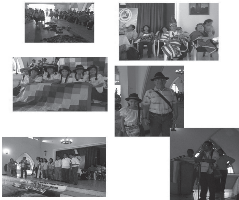
Figura 2. Asamblea y reuniones del cabildo y con otros pueblos

Espacios de talleres: i) Cosmovisión Indígena Yanacona, ii) Formación en Comunicación y Medios, iii) Gobernabilidad y Educación Propia. Los encuentros culturales entre integrantes del Cabildo (Día de la Familia, Inty Raymi). El proceso de construcción de página web del Cabildo Indígena Yanacona de Santiago de Cali, las visitas a territorios de origen y reuniones en Cabildo Mayor Yanacona, la discusión del Plan de Salvaguarda del Pueblo Yanacon.