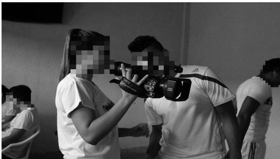
Figura 1. Centro de Formación Juvenil Buen Pastor. Semestre 2016B.