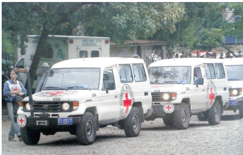
(2007B, Septiembre 10). Entrega de los cuerpos de los exdiputados. El País. [Sección B4]. Cali, Colombia.

encontrado los cuerpos y en qué condiciones, haciendo más evidente la atrocidad de la masacre y produciendo sentimientos de rabia y repudio en contra del grupo guerrillero. Muchos familiares expresaron a los medios que las Farc no eran humanas. Las imágenes de unos familiares destrozados por el dolor y algunos que no aguantaron la entrada a la Morgue para reconocerlos, continuaron reforzando las emociones desde el día en que se anunció el crimen. El balance que mostraron los noticieros por varios días era aterrador: Once familias destruidas por el asesinato de los padres y muchos hijos, esposas y madres agobiados por el dolor que produjo, no sólo la pérdida de sus seres queridos, sino, las condiciones en que habían muerto. Esto dio un sentido tangible a la imagen de la Bandera de Colombia ensangrentada que se multiplicó en la marcha del 4 de febrero, con la inscripción de ¡No más Farc!