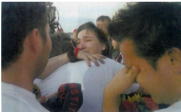
(2008, Febrero 28). Liberación de excongresistas. El País. [Sección Orden 4]. Cali, Colombia.

Son las caras de quienes muchas noches creyeron que jamás se librarían de la más lenta y tortuosa de las muertes de una guerra infernal que no termina. Son los gestos de la dicha que reflejan todo el dolor que emana, ahora está dispuesto a otorgar el paso por la vida, en un país que aprende lento y a fuerza de dolor, que lo único que importa es la integridad y el alma de la gente. (Noticias RCN TV. 2008, Febrero 27).