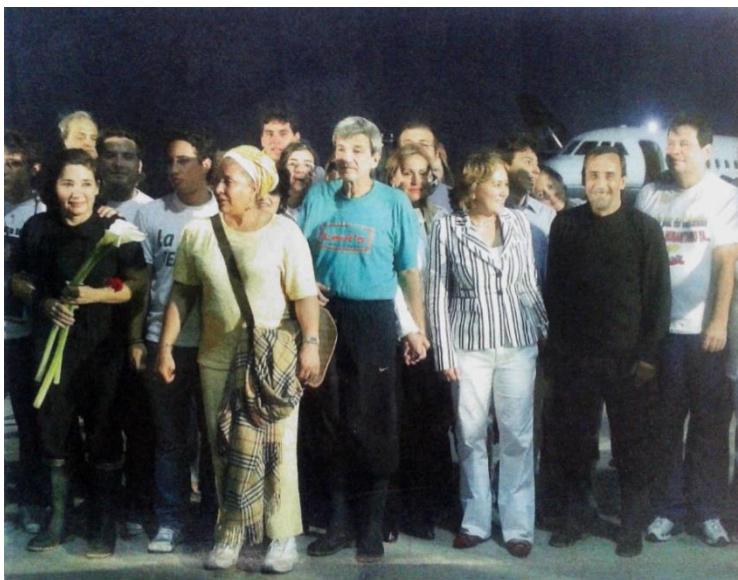
(2008, Febrero 28). Liberación de excongresistas. El País. [Sección Orden 2]. Cali, Colombia.

desmilitarizar los municipios de Pradera y Florida para iniciar las negociaciones del Acuerdo Humanitario.