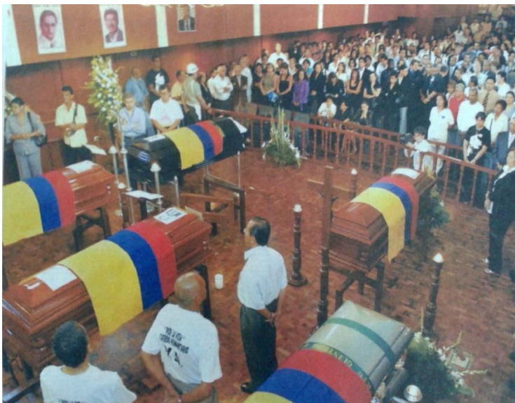
(2007B, Septiembre 13). Honras fúnebres a los exdiputados. El País. [Sección B4]. Cali, Colombia.