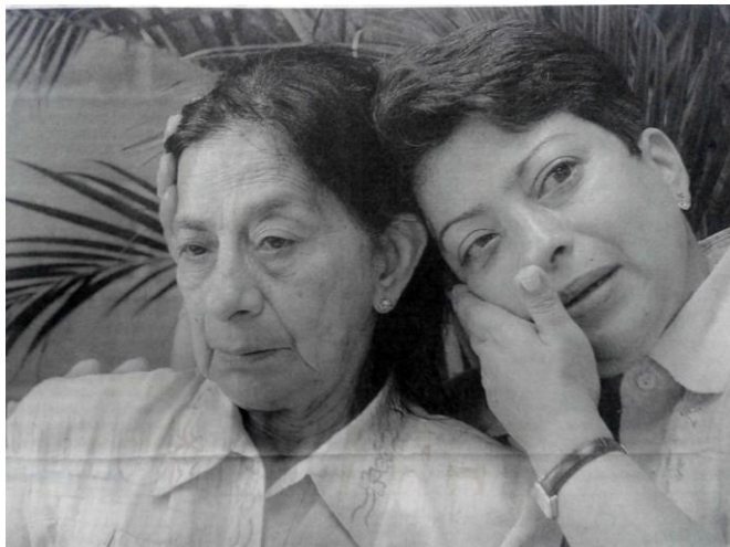
(2007A, junio 29). Asesinato de los once exdiputados. El País. [Sección A4]. Cali, Colombia.