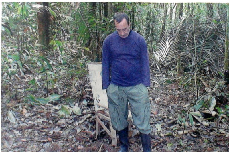
(2007, Diciembre 1). Pruebas de supervivencia. El País. [Sección Orden 4 y 7]. Cali, Colombia.

Las imágenes del excongresista conmovieron en lo más profundo a su esposa. Según Ángela de Pérez esta imagen en la que no dice nada ante las cámaras era la expresión de el grito que quiere lanzar, es no me utilicen más, respétenme yo soy un hombre con dignidad .