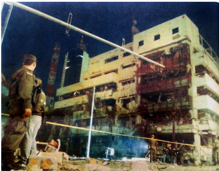
(2007A, abril 9). Bomba contra el Cuartel de la Policía. El País. [Sección A10]. Cali, Colombia.

Días después, las cámaras de seguridad que estaban instaladas cerca al cuartel, mostraron a los medios los momentos previos en los que es dejado y activado el carro bomba y los daños que había causado al cuartel y a los sitios aledaños, para incentivar el sentimiento de repudio contra las Farc. La reiteración de estas imágenes logró concretar la primera movilización de estos dos años contra esta guerrilla, aunque la proporción de personas que salieron a las calles fue menor en relación con las marchas posteriores.