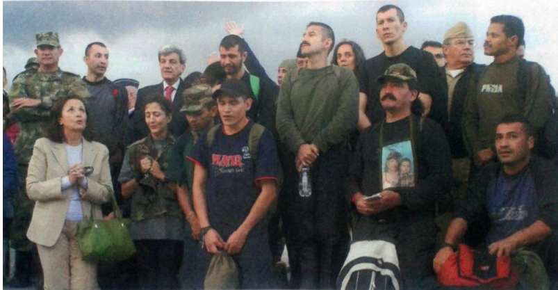
(2008, Julio 3). Operación Jaque. El País. [Sección Orden 4]. Cali, Colombia.

regocijo y agradecimiento a las Fuerzas Armadas, de los 16 liberados que se abrazaban sin cesar por el éxito de la operación, se realizó una campaña mediática constante en favor de las Fuerzas Militares por el éxito de la Operación y mostraban a Ingrid Betancur como el trofeo mayor.