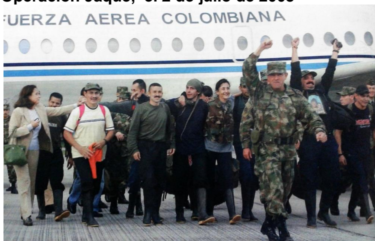
(2008, Julio 3). Operación Jaque. El País. [Sección Orden 2]. Cali, Colombia.

Con esta operación militar, la consigna de “si se puede”, encontró su respuesta y su confirmación más contundente. Con las imágenes que mostraron los medios, de llanto, alegría,