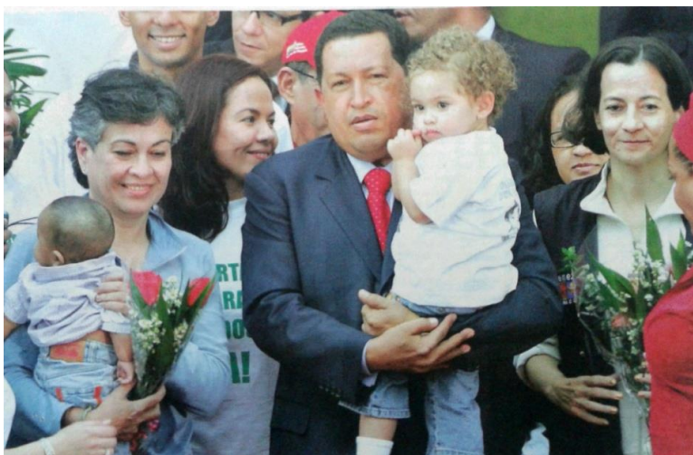
(2008, enero 11). Liberación de Clara y Consuelo. El País. [Sección Orden 4 y 7]. Cali, Colombia.

Pero también se pudo observar la utilización de los niños para fines políticos mucho más evidentes, al aparecer en escenas como lo muestra la siguiente imagen, los niños intercambiados. Por un lado el presidente venezolano, de entonces, Hugo Chávez, con la nieta de Consuelo Perdomo en sus brazos. Y ella con el hijo del primero, igualmente en brazos. Los niños fueron utilizados para dar a entender supuestas posibilidades de reconciliación con la guerrilla, bajo la tutela del Presidente venezolano como su intermediario principal y quien justamente aparece en el centro de la imagen como actor principal.