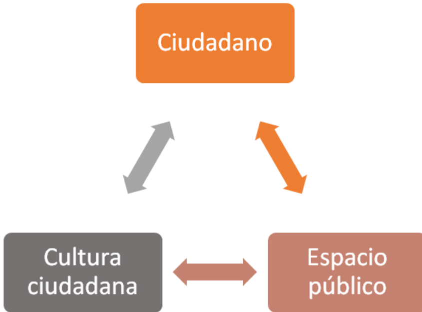
Ilustración 10. Relación interdependiente espacio público, ciudadano, cultura ciudadana