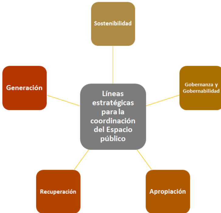
Ilustración 8. Líneas estratégicas para la coordinación del espacio público