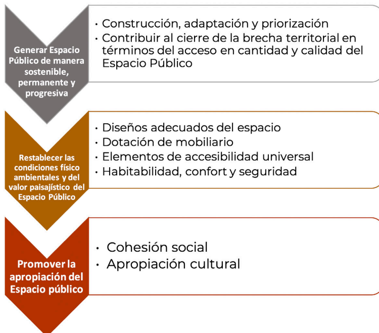
Ilustración 7. objetivos de la política de Espacio público de la ciudad de Cali