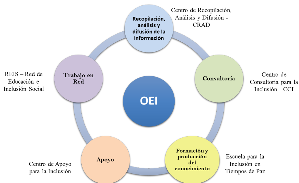
Figura 3. Ejes y unidades operativas del Observatorio de Educación Inclusiva